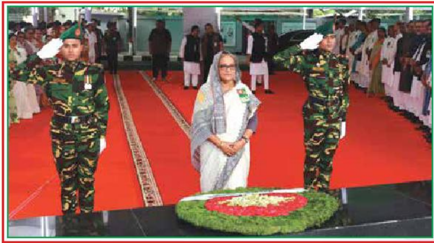
৭ জুন ২০২৩ তারিখে প্রধানমন্ত্রী শেখ হাসিনা ধানমন্ডিতে বঙ্গবন্ধু স্মৃতি জাদুঘরে 'ঐতিহাসিক ৬ দফা দিবস' উপলক্ষ্যে জাতির পিতা বঙ্গবন্ধু শেখ মুজিবুর রহমানের প্রতিকৃতিতে পুষ্পস্তবক অর্পণ শেষে নীরবে দাঁড়িয়ে থাকেন