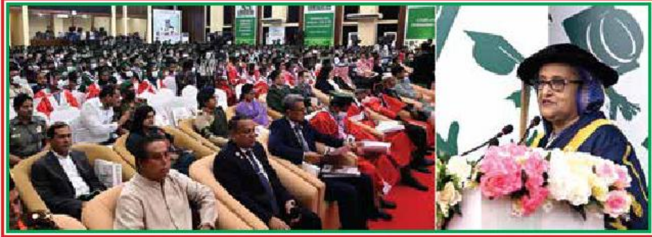
৩০ মে ২০২৩ তারিখে প্রধানমন্ত্রী শেখ হাসিনা গাজীপুরে ইসলামিক ইউনিভার্সিটি অব টেকনোলজির ৩৫তম সমাবর্তন অনুষ্ঠানে বক্তৃতা করেন