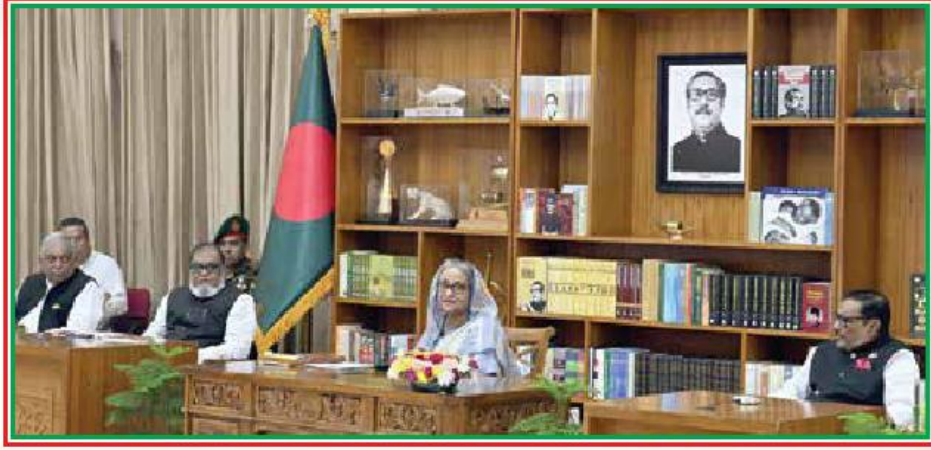
১৮ এপ্রিল ২০২৩ তারিখে প্রধানমন্ত্রী শেখ হাসিনা গণভবনে বিএনপি-জামায়াতের অগ্নিশ্রমাসে নিহত ব্যক্তিবর্গের পরিবার ও আহত ব্যক্তিগণের সাথে ইদের শুভেচ্ছা বিনিময় অনুষ্ঠানে বক্তৃতা করেন