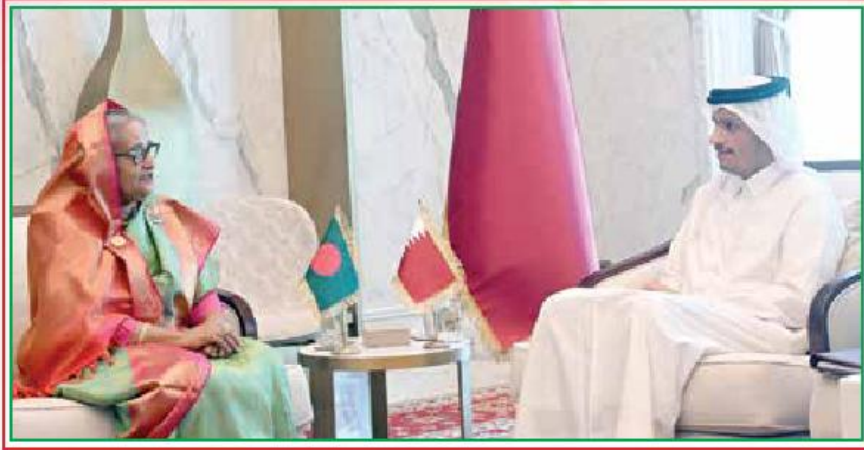
২৩ মে ২০২৩ তারিখে প্রধানমন্ত্রী শেখ হাসিনা কাতারের সোহায় সেদেশের প্রধানমন্ত্রী শেখ মোহাম্মদ বিন আব্দুলরহমান বিন জসিম আল থানির সাথে সাক্ষাৎ করেন