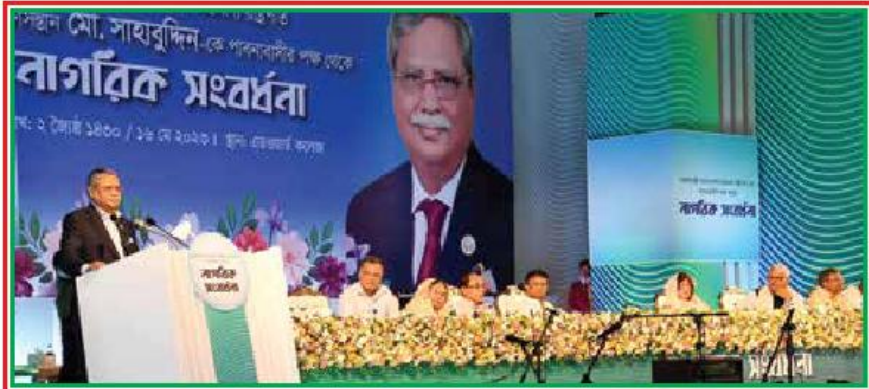
১৬ মে ২০২৩ তারিখে রত্নপতি মোঃ সাহাবুদ্দিন পাবনা অ্যাডওয়ার্ড কলেজ মাঠে নাগরিক কমিটি পাবনা কর্তৃক 'নাগরিক সংবর্ধনা' প্রদান অনুষ্ঠানে ভাষণ দেন