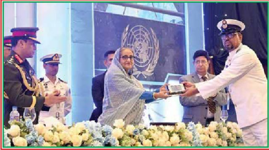
২৯ মে ২০২৩ তারিখে প্রধানমন্ত্রী শেখ হাসিনা ঢাকায় বঙ্গবন্ধু আন্তর্জাতিক সম্মেলন কেন্দ্রে আন্তর্জাতিক জাতিসংঘ শান্তিরক্ষী দিবস-২০২৩ উপলক্ষে আয়োজিত অনুষ্ঠানে জাতিসংঘ শান্তিরক্ষা মিশনে শহিদ ও আহত শান্তিরক্ষীদের সম্মাননা প্রদান করেন