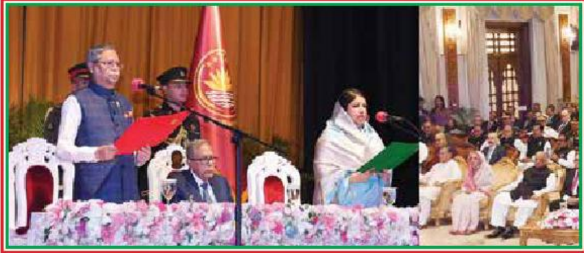
২৪ এপ্রিল ২০২৩ তারিখে বঙ্গভবনের দরবার হলে মোঃ সাহাবুদ্দিনকে ২২তম রত্নপতি হিসেবে শপথবাক্য পাঠ করান স্পিকার ড. শিরীন শারমিন চৌধুরী। প্রধানমন্ত্রী শেখ হাসিনা, তাঁর ছোট বোন শেখ রেহানা ও বিদায়ি রত্নপতি মোঃ আবদুল হামিদ এসময় উপস্থিত ছিলেন