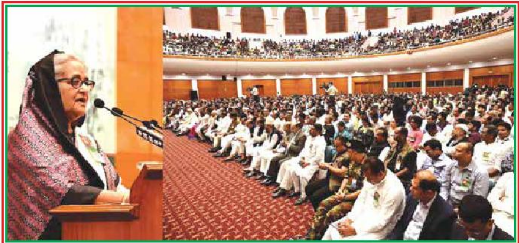
৭ জুন ২০২৩ তারিখে প্রধানমন্ত্রী শেখ হাসিনা ঢাকার বঙ্গবন্ধু আন্তর্জাতিক সম্মেলন কেন্দ্রে ঐতিহাসিক '৬ দফা দিবস' উপলক্ষে বাংলাদেশ আওয়ামী লীগ আয়োজিত আলোচনা সভার সভাপতির বক্তব্য রাখেন