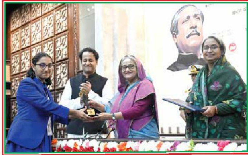
১১ জুন ২০২৩ তারিখে প্রধানমন্ত্রী শেখ হাসিনা তাঁর কার্যালয়ের শাপলা হলো 'বঙ্গবন্ধু সৃজনশীল মেধা অন্বেষণ-২০২৩' এর সেরা মেধাবী পুরস্কার এবং 'বঙ্গবন্ধু শেখ মুজিব স্কার অ্যাওয়ার্ড, ২০২২' প্রদান করেন