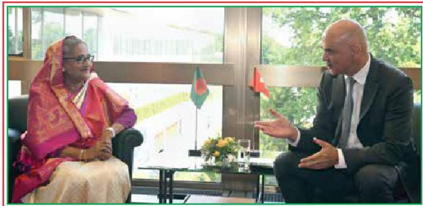
১৪ জুন ২০২৩ তারিখে প্রধানমন্ত্রী শেখ হাসিনা জেনেভায় প্যালাহিস দেশ লেশনসে সুইস কনফেডারেশনের প্রেসিডেন্ট অ্যালাইন বারলেটের সাথে বৈঠক করেন