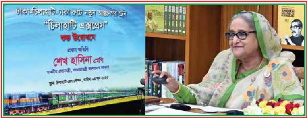
৪ জুন ২০২৩ তারিখে প্রধানমন্ত্রী শেখ হাসিনা গণভবন থেকে স্মিডিও কনকারেলিয়েটরের মাধ্যমে নীলকামারীর চিলাহাটি রেলগুয়ে স্টেশনে আয়োজিত ঢাকা-চিলাহাটি-ঢাকা রুটে আন্তঃনগর ট্রেন 'চিলাহাটি এক্সপ্রেস' উদ্বোধন করেন