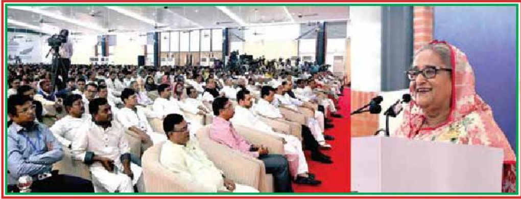
৩ জুন ২০২৩ তারিখে প্রধানমন্ত্রী ও বাংলাদেশ আওয়ামী লীগ সভাপতি শেখ হাসিনা ডেঙ্গাপুরে ঢাকা জেলা আওয়ামী লীগের নবনির্মিত কার্যালয় উদ্বোধন অনুষ্ঠানে বক্তৃতা করেন