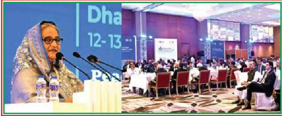
১২ মে ২০২৩ তারিখে প্রধানমন্ত্রী শেখ হাসিনা ঢাকার হোটেল ইন্টারকন্টিনেন্টালে ষষ্ঠ ভারত মহাসাগর সম্মেলনের উদ্বোধন অনুষ্ঠানে বক্তৃতা করেন