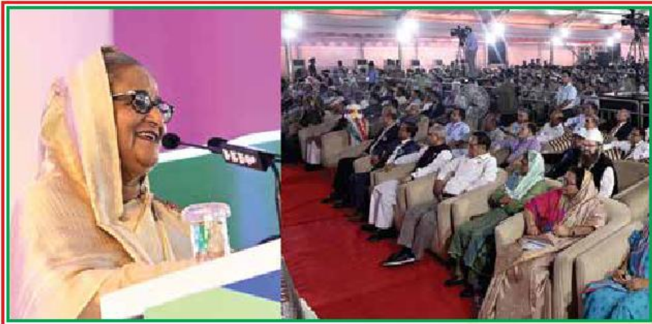
১৩ মে ২০২৩ তারিখে প্রধানমন্ত্রী শেখ হাসিনা ঢাকার আইইবি প্রাক্ষে ইঞ্জিনিয়ার্স ইনস্টিটিউশন, বাংলাদেশ এর ৬০তম কনভেনশনের উদ্বোধন অনুষ্ঠানে বক্তৃতা করেন