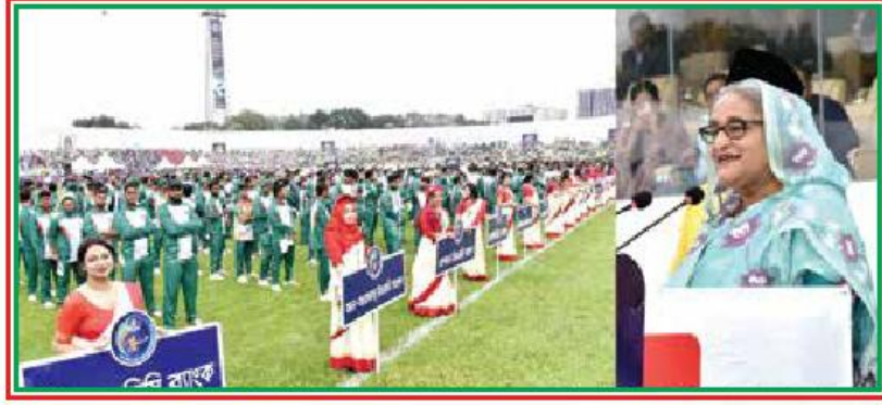
৯ জুন ২০২৩ তারিখে প্রধানমন্ত্রী শেখ হাসিনা ঢাকার বাংলাদেশ আর্মি স্টেডিয়ামে 'শেখ হাসিনা আন্তর্জাতিক ফুটবল টুর্নামেন্ট' এর ফাইনাল খেলা অনুষ্ঠানে বক্তৃতা করেন