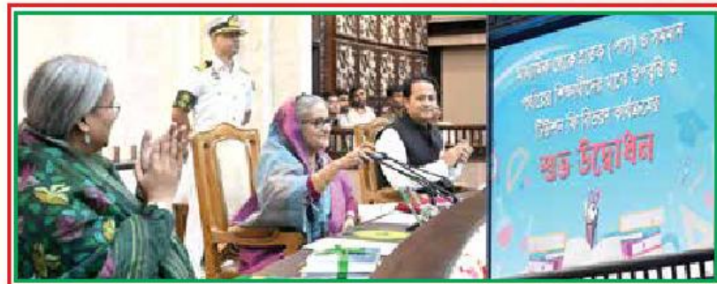
১১ জুন ২০২৩ তারিখে প্রধানমন্ত্রী শেখ হাসিনা তাঁর কার্যালয়ের শাপলা হলো মাসিক থেকে স্নাতক (পাস) ও সমমান পর্যায়ে অসম্পূর্ণ ও মেধাবী শিক্ষার্থীদের মাঝে উপবৃত্তি ও টিউশন ফি বিতরণ কার্যক্রমের উদ্বোধন করেন