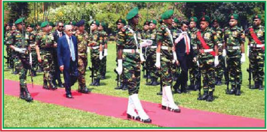
২৪ এপ্রিল ২০২৩ তারিখে বিদায়ি রত্নপতি মোঃ আবদুল হামিদকে বঙ্গভবনে প্রেসিডেন্ট গার্ড রেজিমেন্ট গার্ড অব অনার প্রদান করে